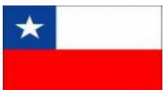
Colegio de Chile