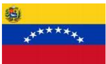
Colegio de Venezuela