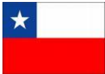
Colegio de Chile