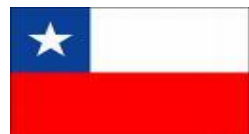
Colegio de Chile